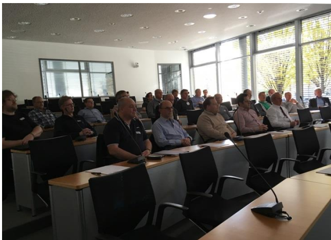
Die FED Regionalgruppe Hannover bei Lenze

Unterseite der Baugruppe identifizieren. Durch systematisches Durchreichen des Protokolls einer Baugruppe von einem Linienmodul an das nächste könnte das Scannen der Baugruppen-ID auf eine Position am Anfang der Linie reduziert werden. Das HERMES Protokoll würde eine stationsweise Umrüstung der Produktionslinie inklusive Spurbreitenverstellung erlauben. Ob ältere Produktionsanlagen noch mit dem HERMES STANDARD Protokoll ausgerüstet werden, hängt von den jeweiligen Maschinenherstellern ab. Wichtig ist, dass jeder manuelle Eingriff in den Materialfluss (z.B. Entnahme einer fehlerhaften Baugruppe) auch die „Entnahme“ des